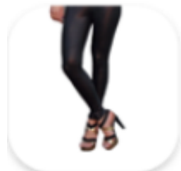
Modelo de salto alto