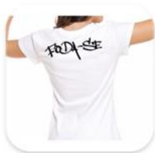
Apologia a palavras