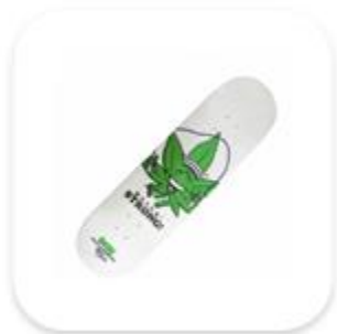
Apologia à drogas