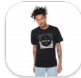
Modelo com artigo não esportivo jeans