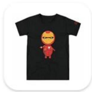
Homem de ferro